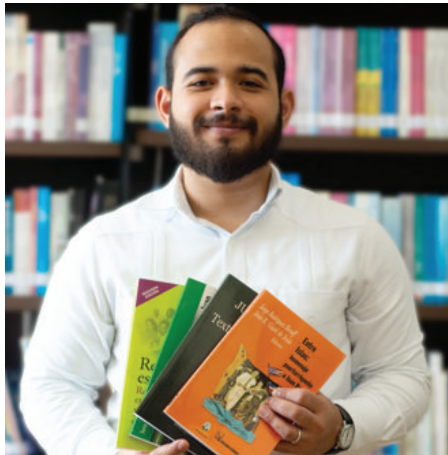
Donación entregada a la Asociación de Estudiantes de Ciencias Políticas (ASECIPOL) para ser utilizado en el Simposio «Encuentro entre las Ciencias Sociales».