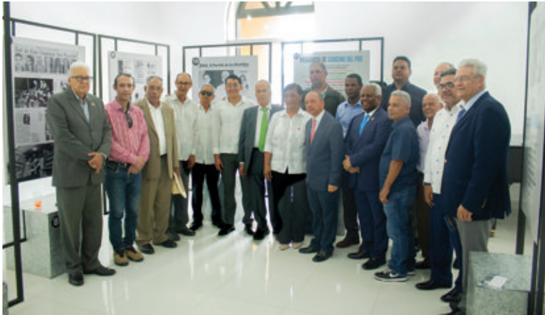
Miembros de la Junta Directiva y colaboradores de la FJB, junto a autoridades de La Vega y del país durante la inauguración de la exposición.