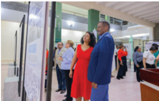
Vista panorámica de la exposición.