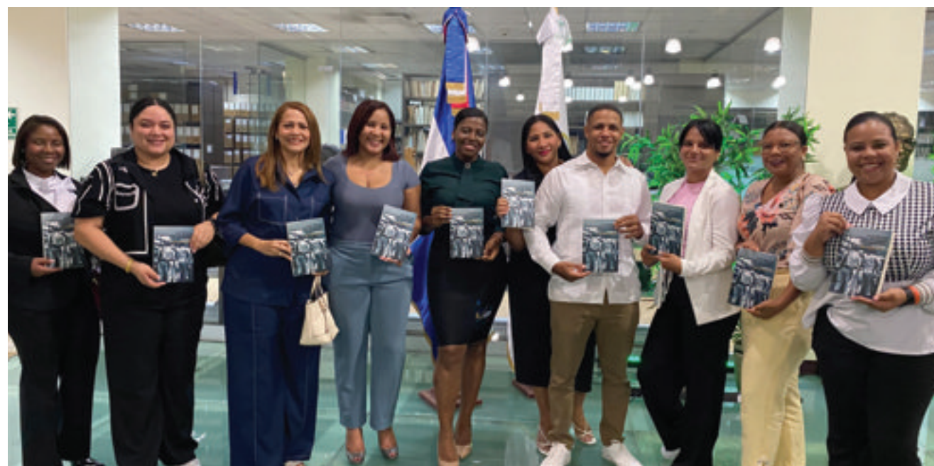
Estudiantes de UNICARIBE muestran la obra.

La Fundación Juan Bosch invitó al público a leer esta obra con espíritu crítico, consciente de que muchas de las amenazas a la democracia denunciadas por Bosch hace seis décadas —como la manipulación mediática, la corrupción, la injerencia extranjera y el descrédito de la política— siguen vigentes en el presente.