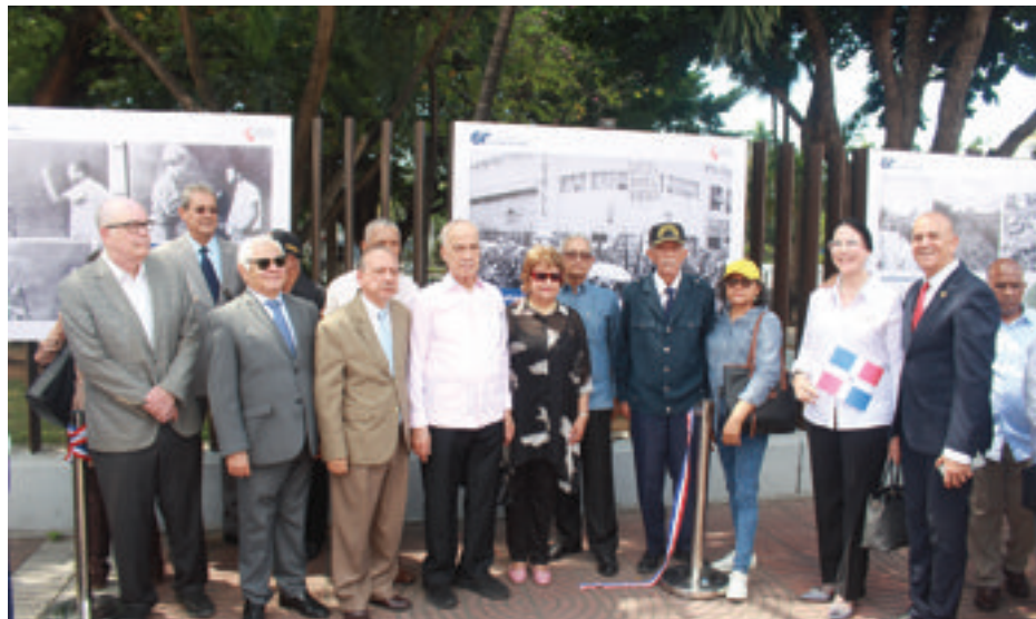
Miembros de la Junta Directiva de la FJB presentes en la inauguración de la exposición.