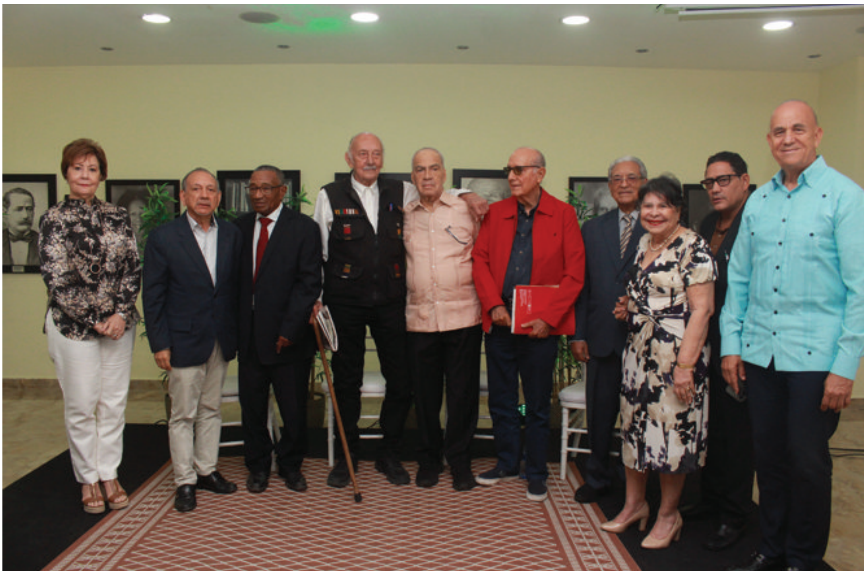
Directivos de la FJB acompañados de panelistas, invitados y autoridades del país.