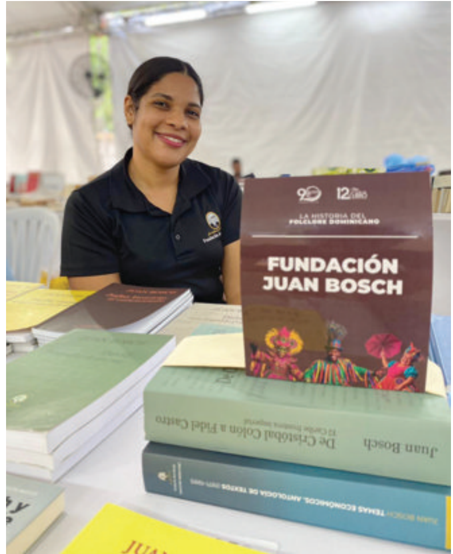
Participación de la FJB en la duodécima Feria del Libro de Historia Dominicana, organizada por el AGN.