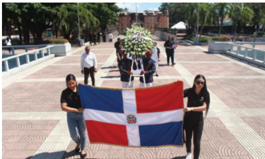
Marcha para depositar la ofrenda.