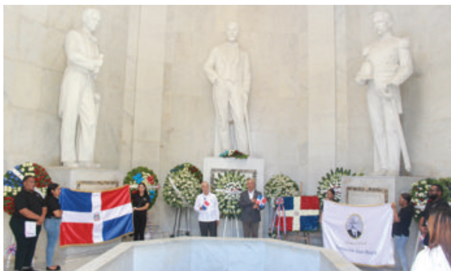
La FJB deposita la ofrenda en el Altar de la Patria.