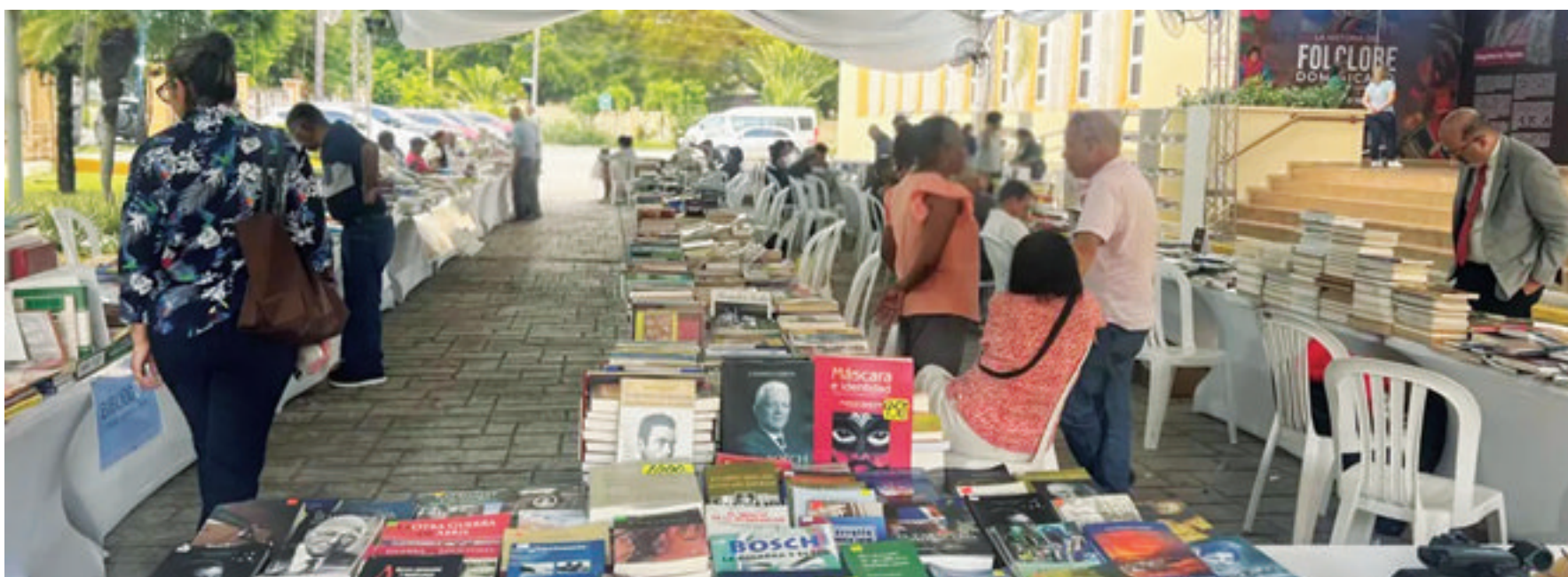
Participación de la FJB en la duodécima Feria del Libro de Historia Dominicana, organizada por el AGN.