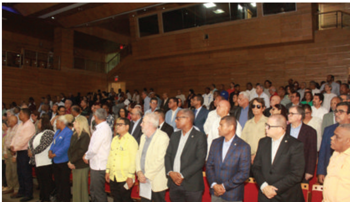
Parte del público asistente al panel.