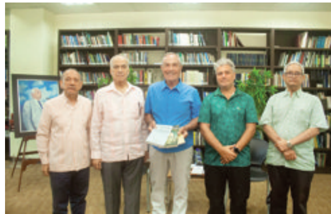
Miembros de la Junta Directiva de la FJB junto al invitado Alan Bersin.