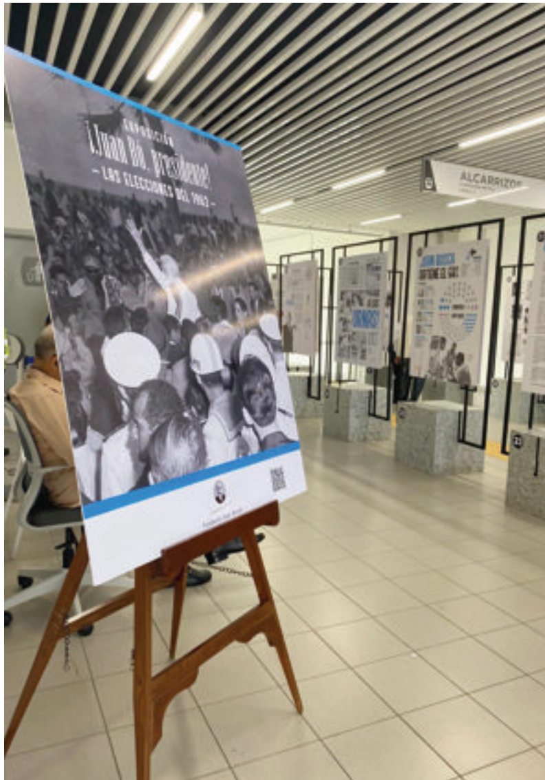
Vista parcial de la exposición en el Teleférico de Los Alcarrizos.