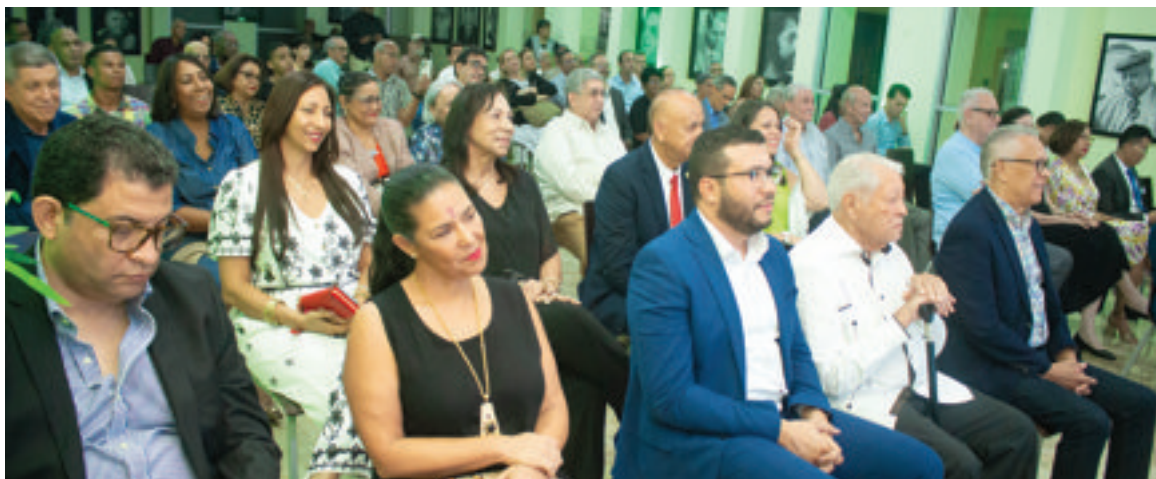
Parte del público asistente a la actividad.