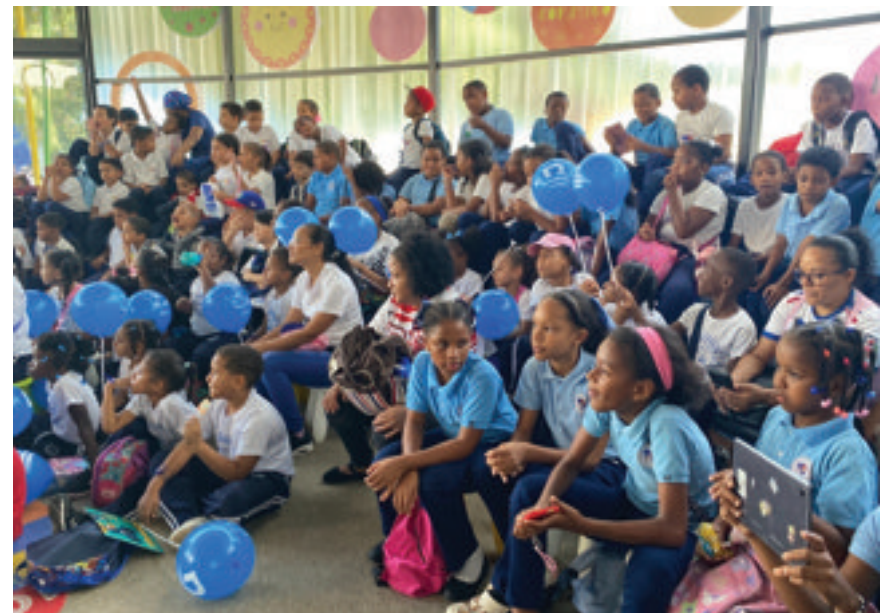
Representación teatral de «Las fábulas de Juanito»