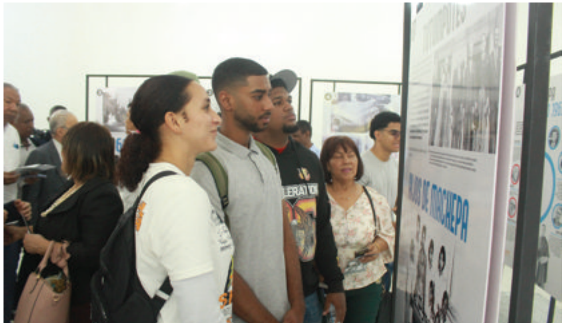
Público asistente a la actividad.