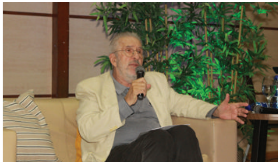
Conferencista argentino Atilio Borón, prestigioso politólogo, sociólogo, catedrático y ensayista.