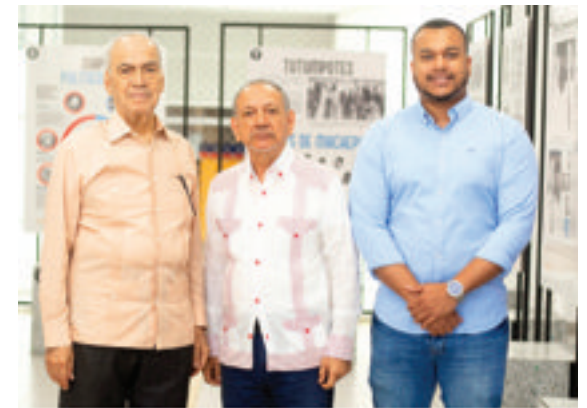
Inauguración de la exposición en el Teleférico de Los Alcarrizos.

Tras quedar inaugurada la muestra, exhibida en el Teleférico de Los Alcarrizos del 7 al 26 de noviembre, miembros y colaboradores de la Fundación recorrieron la feria y compartieron con los estudiantes y el público presente.