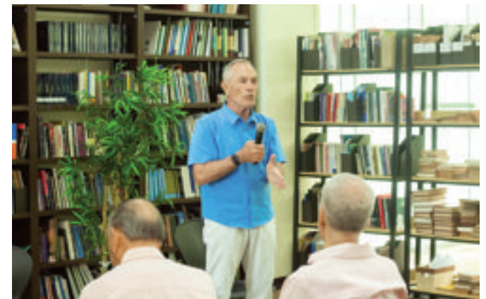
En otro momento del conversatorio el orador se dirige al público.