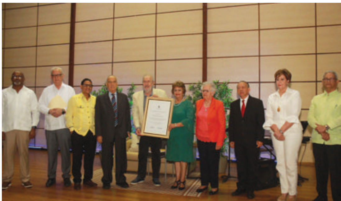
Miembros de la Junta Directiva de la FJB entregan reconocimiento a Atilio Borón.