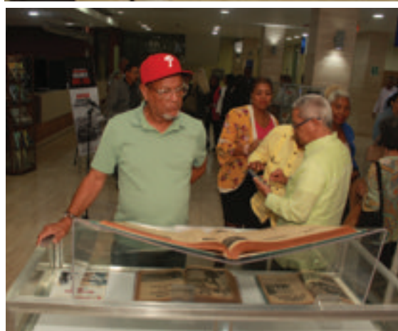
Inauguración de la exposición bibliográfica en la BNPHU.