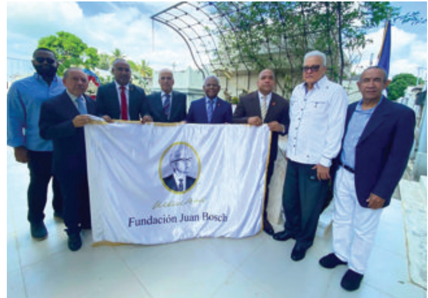
Miembros de la Junta Directiva de la FJB, junto a autoridades de La Vega, depositan la ofrenda.