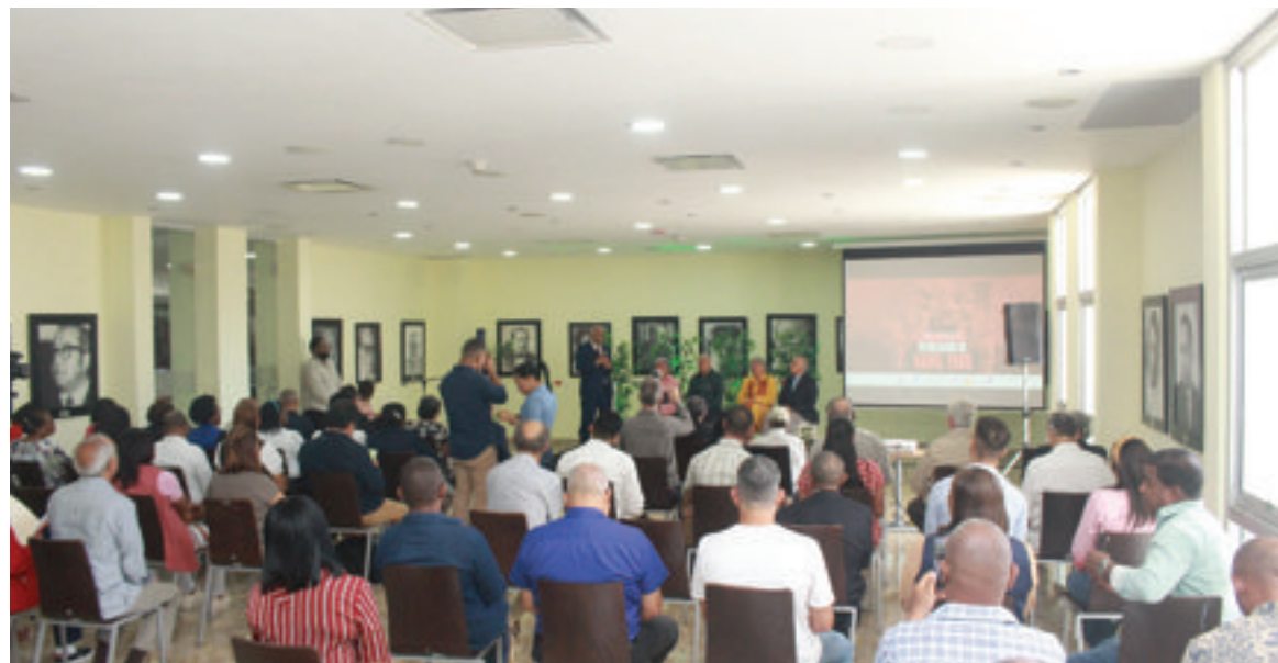
Público asistente al panel.