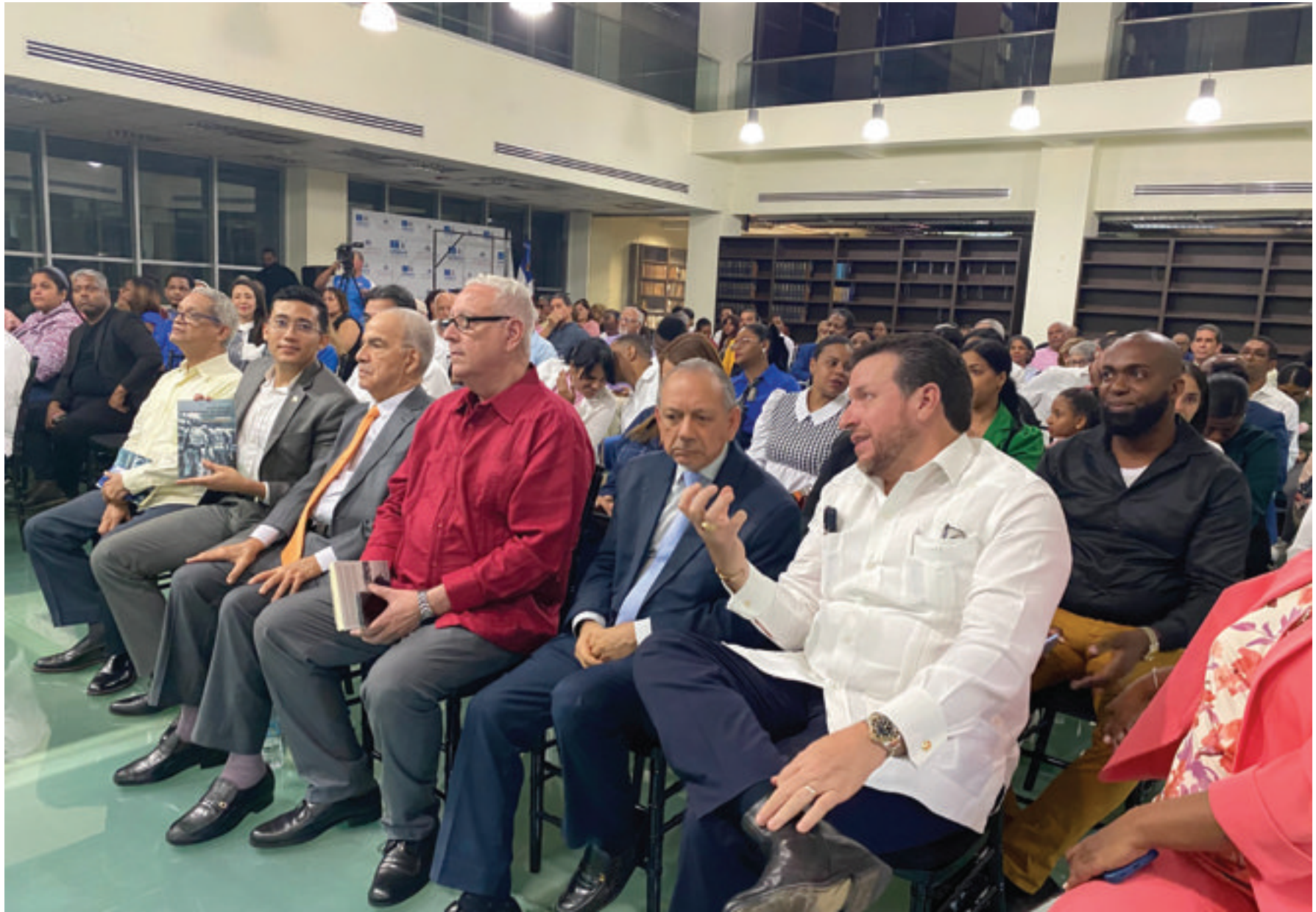
Vista panorámica de los asistentes.