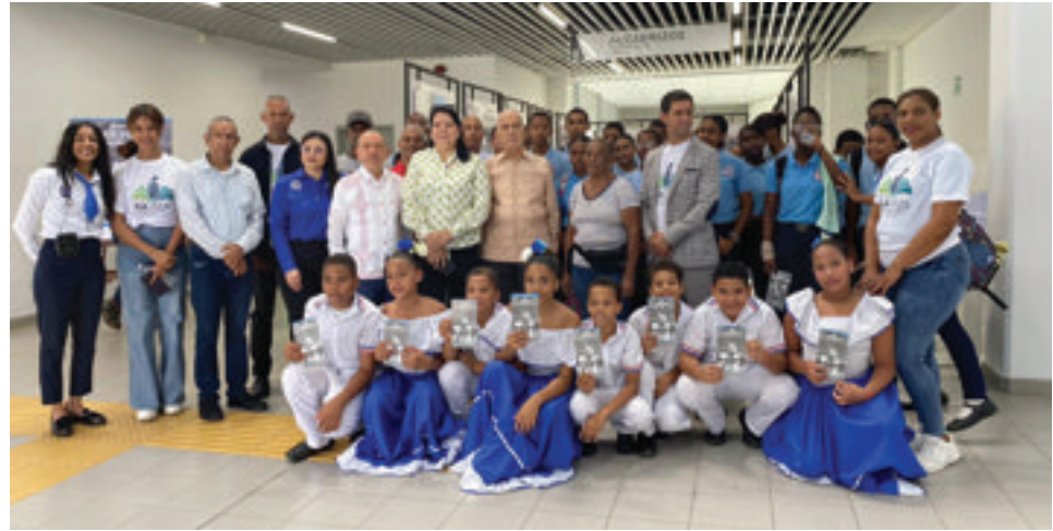
Miembros de la Junta Directiva y colaboradores de la FJB, directivos de la feria y estudiantes presentes en la actividad.