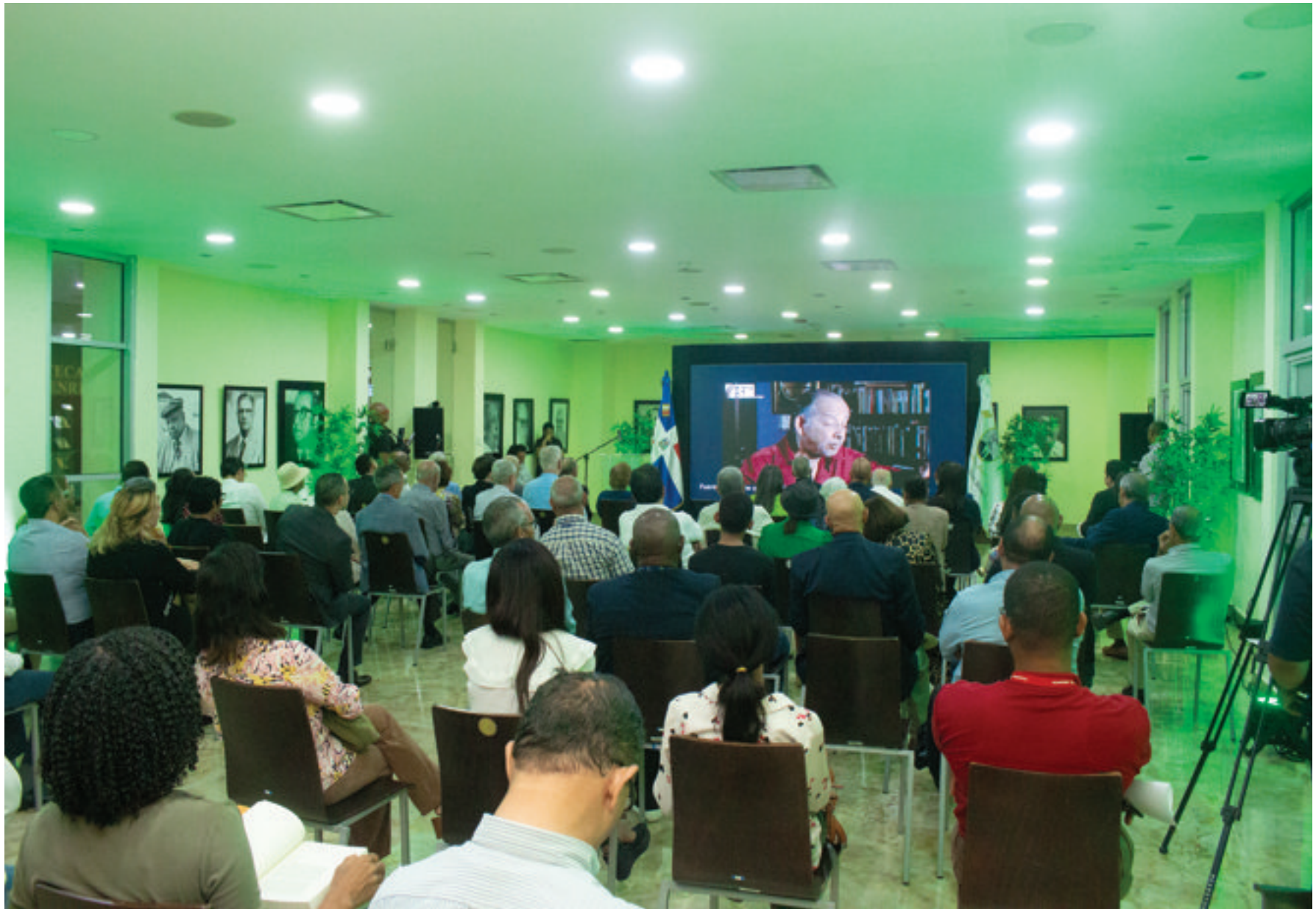
Vista parcial de los asistentes a la premiación.