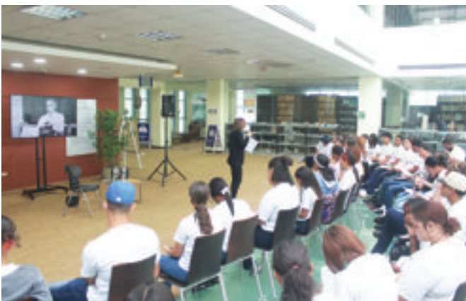
Vista parcial de los estudiantes en la actividad.