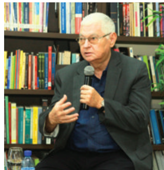
Conversatorio con Omar González, exviceministro de Cultura de Cuba y ganador del premio Casa de las Américas (1978).

El encuentro se convirtió en un espacio de intercambio y reflexión que permitió tender puentes entre las realidades culturales de Cuba y la República Dominicana, reafirmando la importancia del pensamiento crítico, la memoria y la palabra como herramientas para fortalecer la conciencia social y la colaboración entre pueblos hermanos.