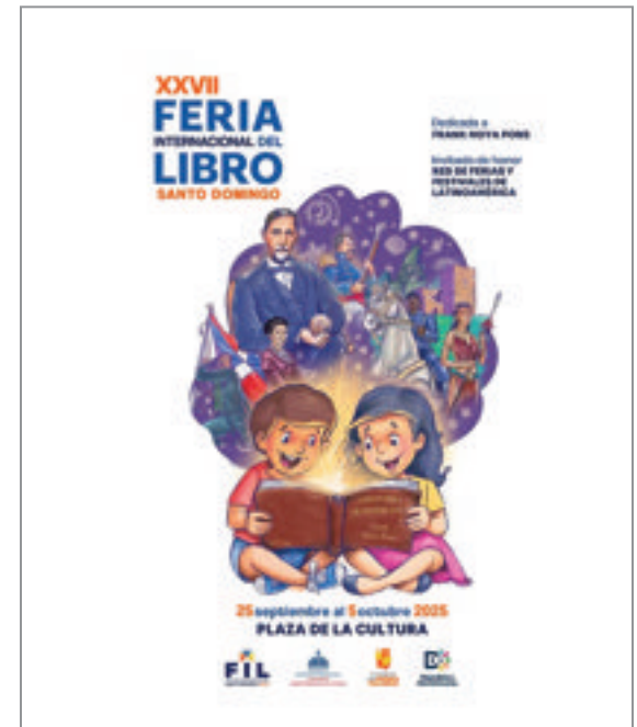
Arte promocional de la XXVII Feria Internacional del Libro Santo Domingo 2025.

En el transcurso de la feria, la Fundación promovió los distintos títulos que conforman su catálogo editorial, facilitando el acceso del público a los libros y fomentando el hábito de la lectura.