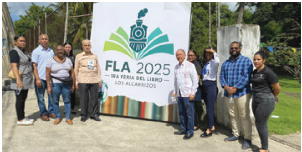
Miembros de la Junta Directiva, colaboradores de la FJB e invitados en la entrada de la feria.