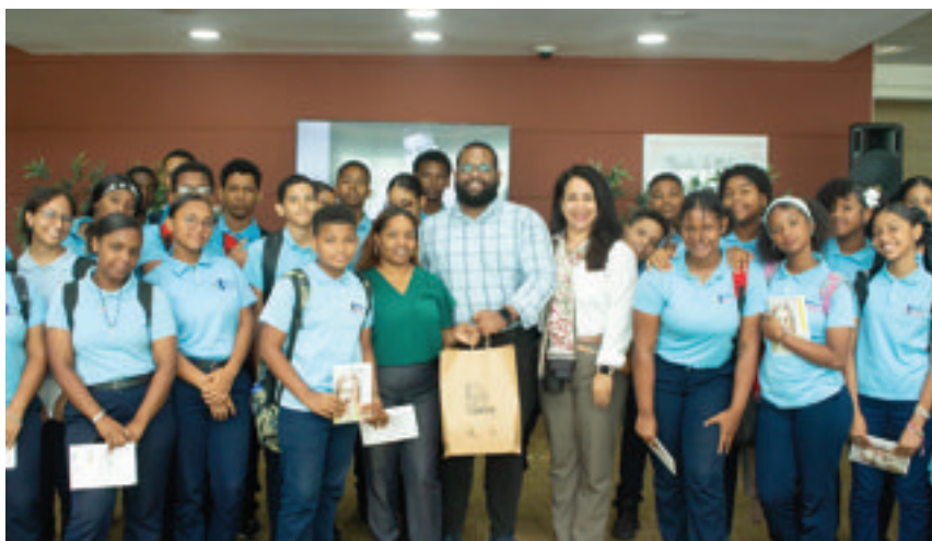
Donativo entregado al Centro de Excelencia República de Colombia durante su visita a las instalaciones de la FJB.