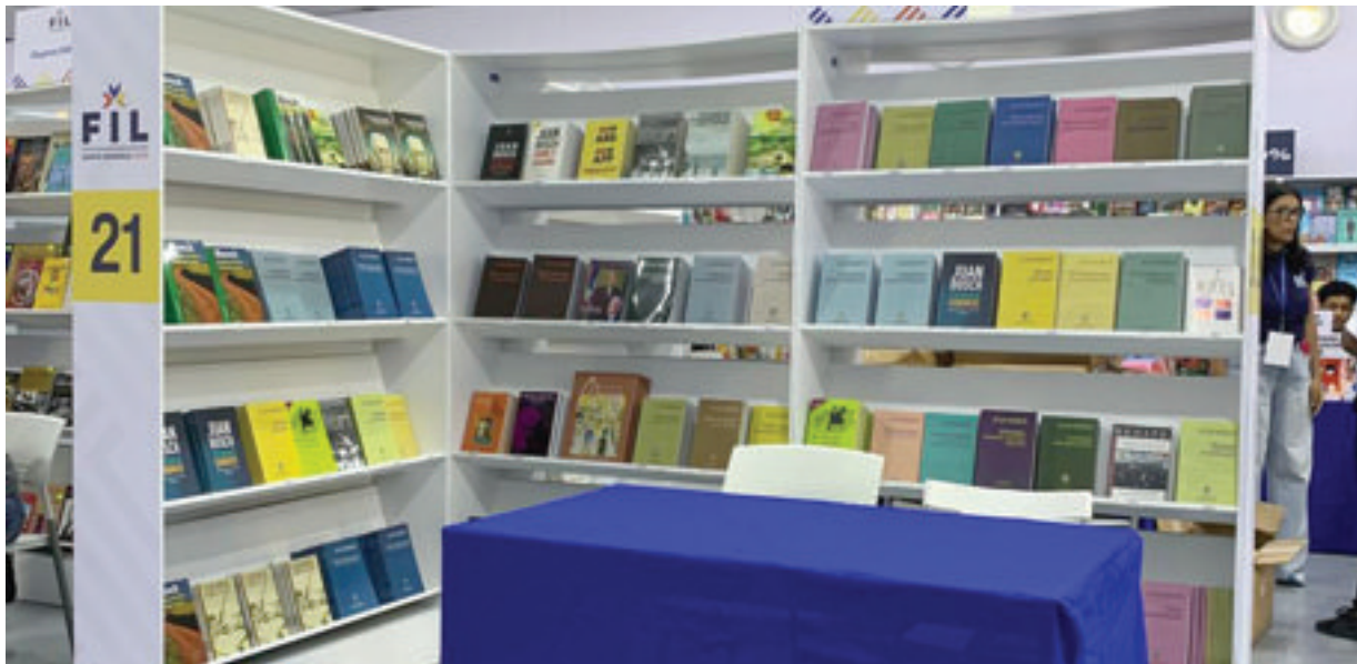
Participación de la Fundación Juan Bosch en la Feria Internacional del Libro Santo Domingo 2025