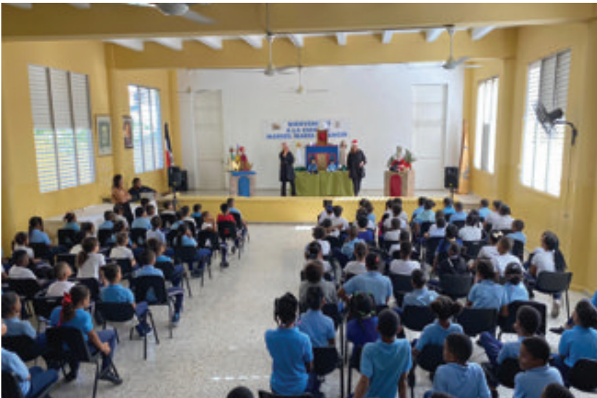
Estudiantes de la Escuela Primaria Manuel María Valencia observan la obra.