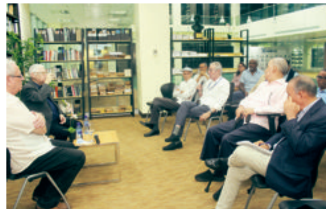
Sección de preguntas y respuestas.