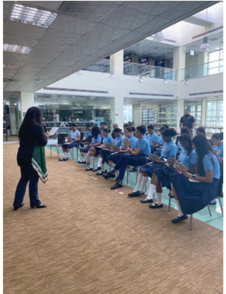
Vista parcial de los estudiantes en el conversatorio..