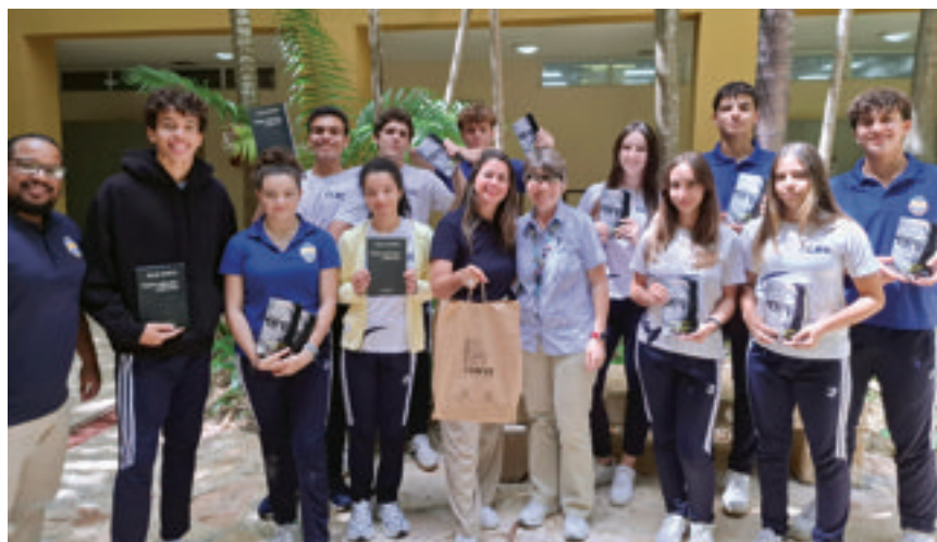
Donativo efectuado al Cap Cana Heritage School, recibido por sus estudiantes y maestros.