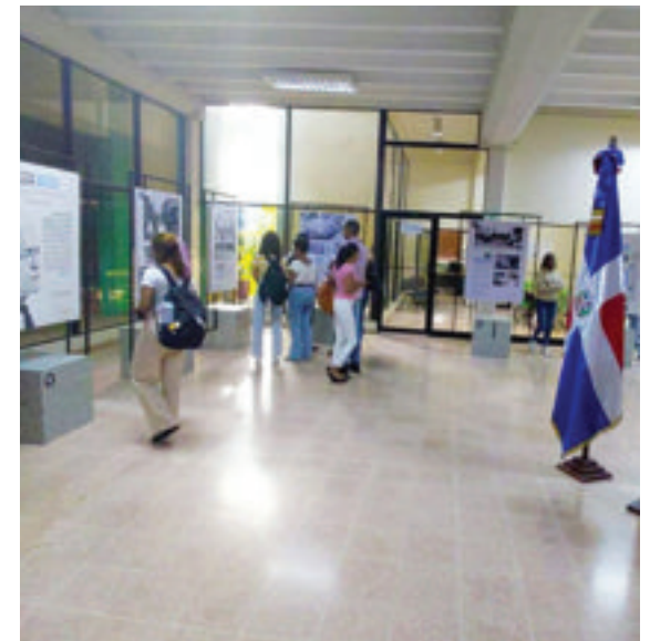
Vista panorámica de la exposición en San Pedro de Macorís.

En el marco de esta actividad, la Fundación realizó la donación de las Obras completas de Juan Bosch a la biblioteca de la universidad. Este aporte contribuye a fortalecer el acervo bibliográfico del centro académico y pone a disposición de estudiantes, docentes e investigadores una fuente de consulta fundamental para el estudio de su pensamiento y legado.