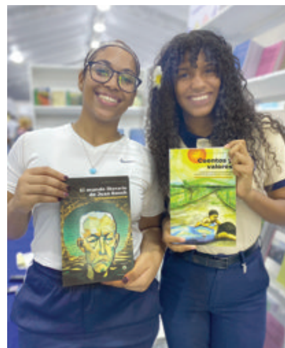
Participación de la Fundación Juan Bosch en la Feria Internacional del Libro Santo Domingo 2025