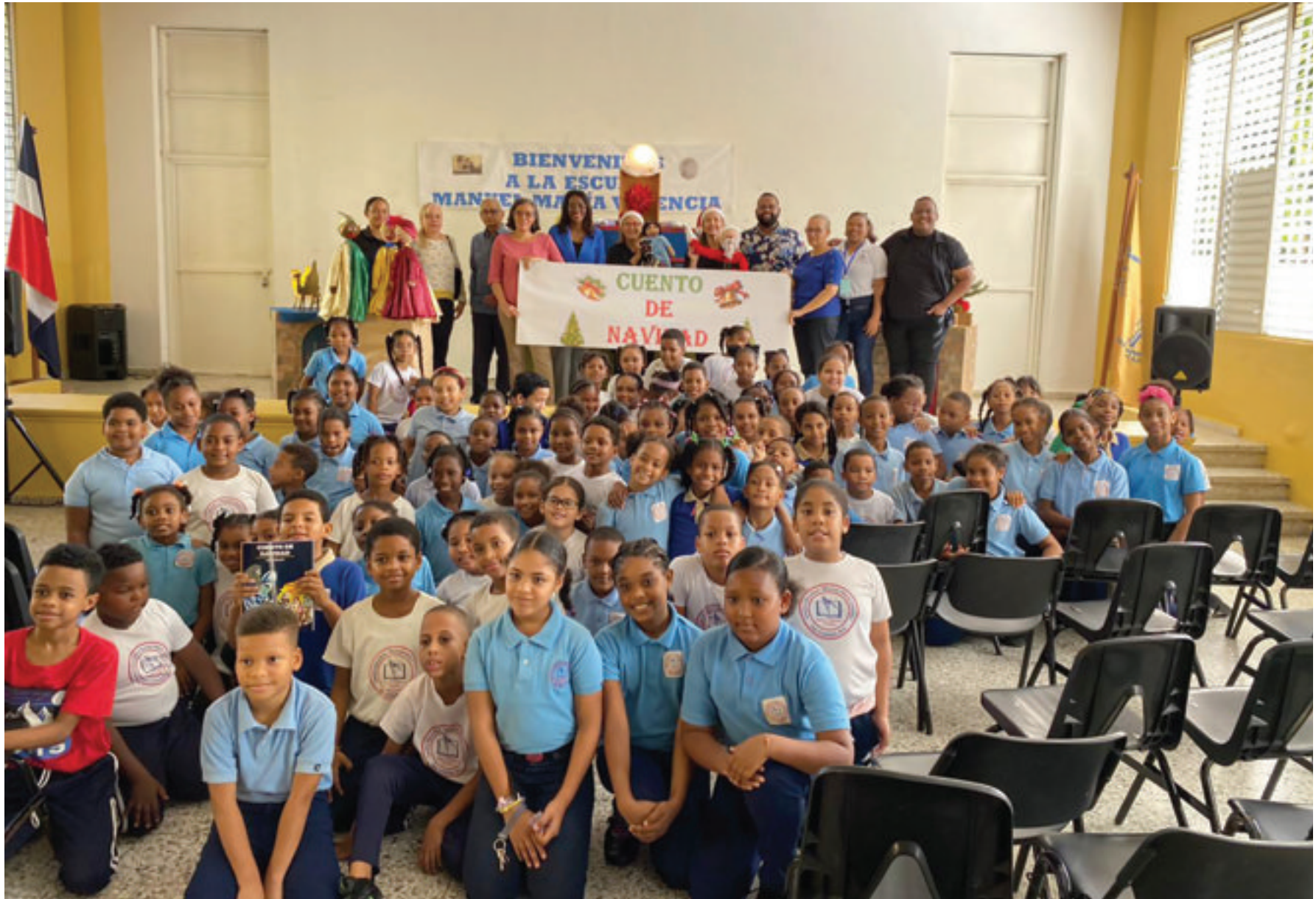
Estudiantes al finalizar la actividad.