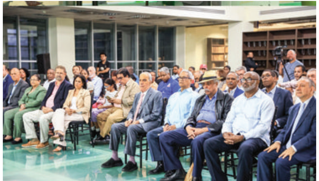
Vista panorámica del público asistente.

La Fundación Juan Bosch reafirmó, en el marco de este acto, su compromiso con la difusión del legado del maestro y la promoción del pensamiento crítico en torno a la democracia.