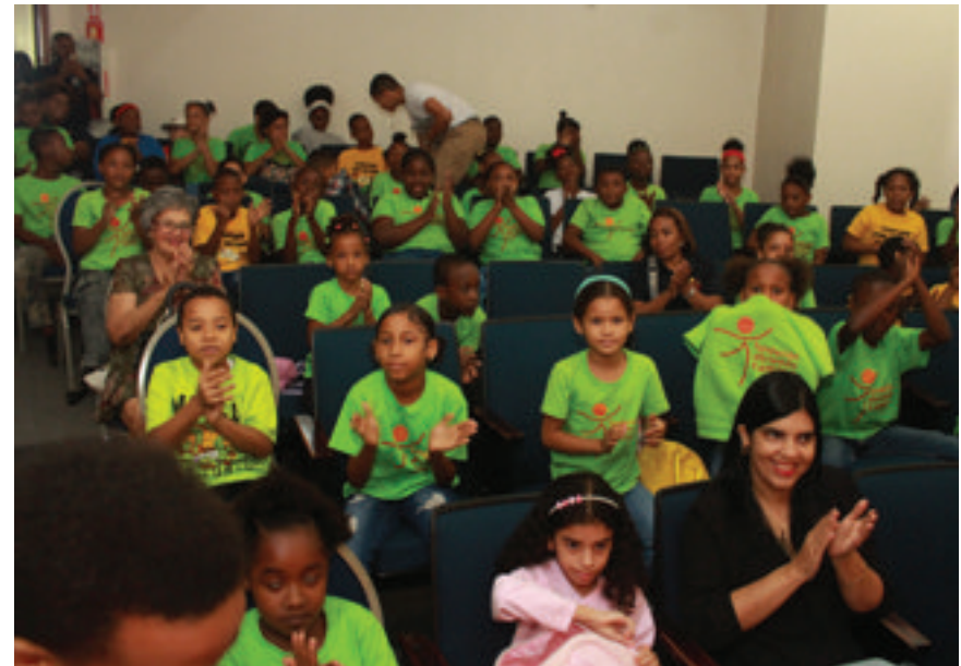
Representación teatral de «Las fábulas de Juanito»