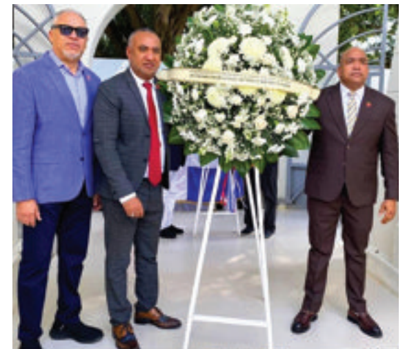
Invitados depositan la ofrenda.

Ambas actividades formaron parte de la agenda conmemorativa destinada a preservar y difundir el pensamiento y el legado de Juan Bosch. La Fundación continúa promoviendo la memoria histórica y el fortalecimiento de los valores democráticos.