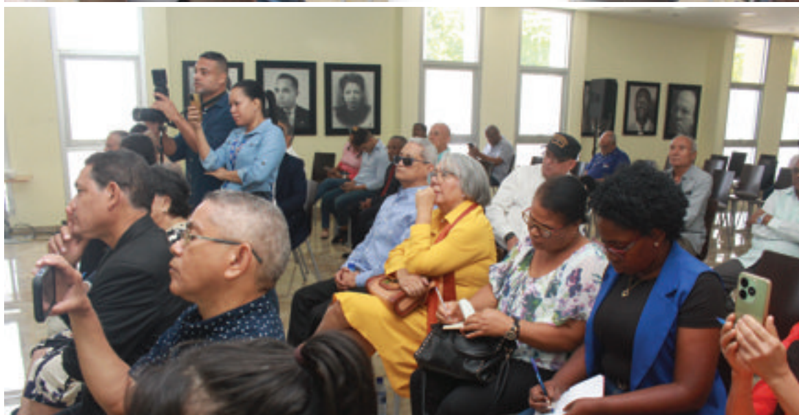
Público asistente al segundo panel.